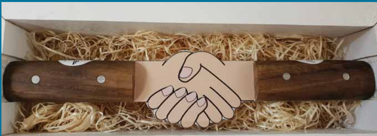
Depechen produceret af FGU Syd- og Vestsjælland

I Slagelse blev både design og fremstilling af depechen til et fællesskabende projekt på den lokale produktionshøjskole. På tværs af kreative værksteder idéudviklede, tegnede og fremstillede eleverne depechen, hvormed den allerede ved sin tilblivelse var med til at styrke fællesskabet på tværs.