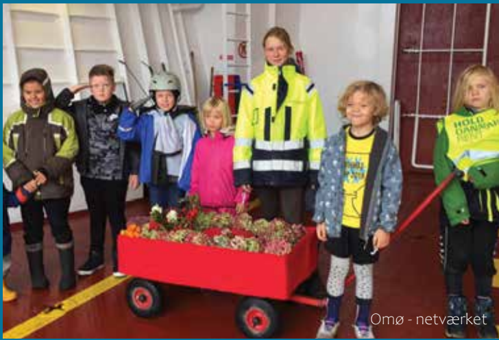
Omø - netværket